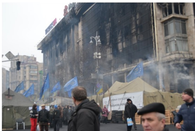
Grundet kampe mellem politi og demonstranter blev stor-skærmen og hele huset raseret af flere brandbomber. Her et billede fra marts 2014

Artiklen er skrevet af Mario Presutti årgang