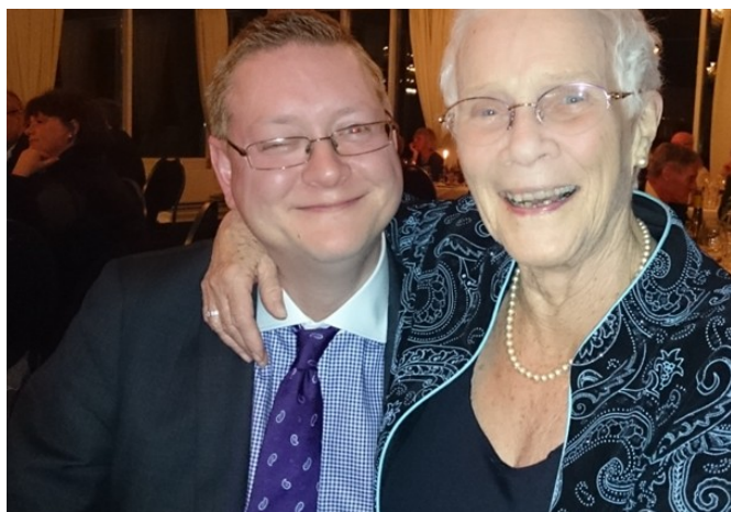
Formanden med en dejlig dame på skødet

De af os, som deltog, kunne nyde en udsøgt middag bestående af grillet tun med tomatsalat toppet med limeskum, dyreinderlår med kastanjer, vilde svampe, bagte rodfrugter samt brombærreduktion med hvide kartofler og rødvinssauce. Til dessert blev der serveret mandelchokoladecake med orangecreme og jordbærchutney. Til natmad fik vi aspargesuppe og hjemmebagt brød.