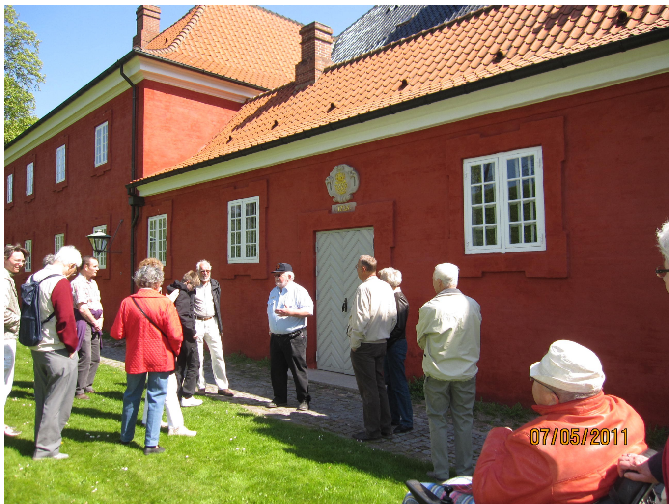
Her ses de intens lyttende deltagere med guiden i midten