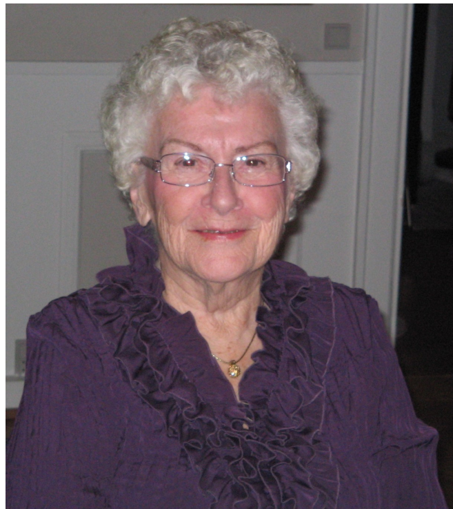
En af de flittigste deltagere - og en af de yndigste

Husk at hold øje med tidlig tilmeldingsfrist og billig pris til næste års stiftelsesfest.