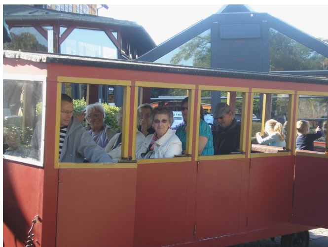
Glade deltagere på den lærerige togtur