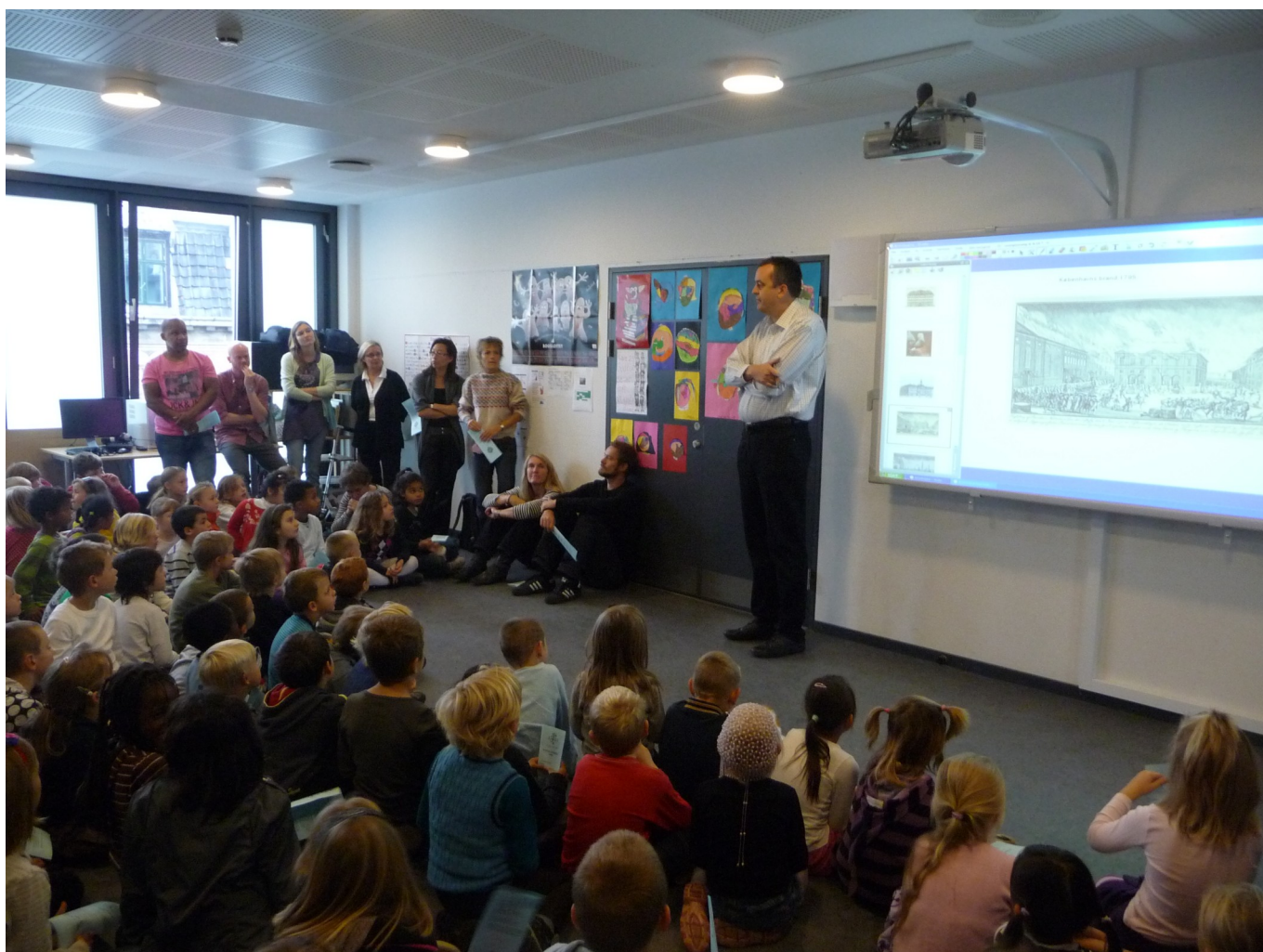
Foto fra et klasselokale med en interaktiv tavle