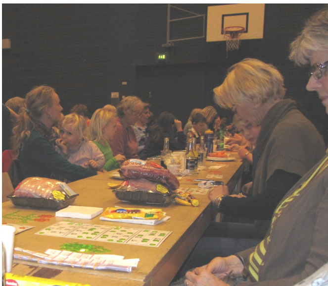
Dyb koncentration - er jeg mon den heldige vinder!