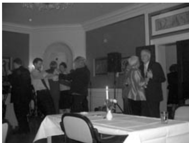
Senere var der også fest på dansegulvet.