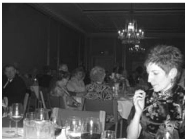
Der var gang i samtalerne ved bordene.

Efter desserten fortrak vajsenhusierne til kaffestuerne, hvor der blev serveret likør af alle slags, kaffe og kage samt øl og vand ad libitum. Aftenen sluttede med masser af dans til det hyrede band og sluttede kl. 1.00 i en god og hyggelig stemning efter en endnu vellykket stiftelsesfest