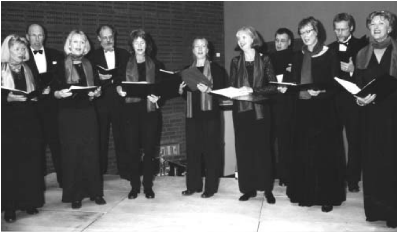
Bi-koret som sang hele den gamle kantate under festlighederne d. 7. oktober.