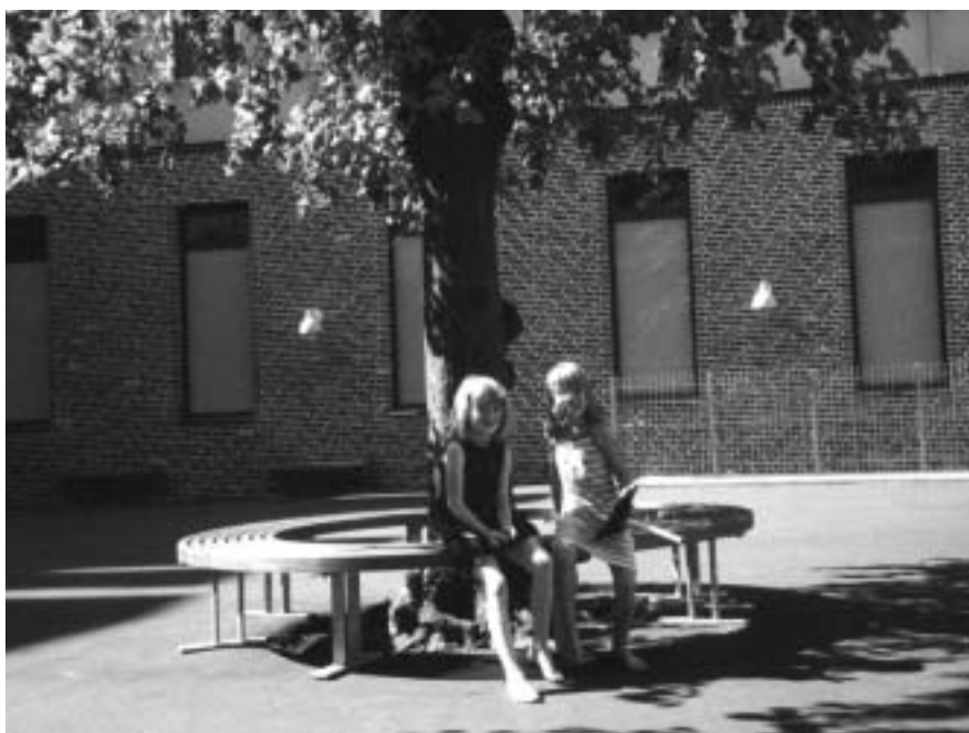
DGM's jubilæumsgave til Vajsenhuset