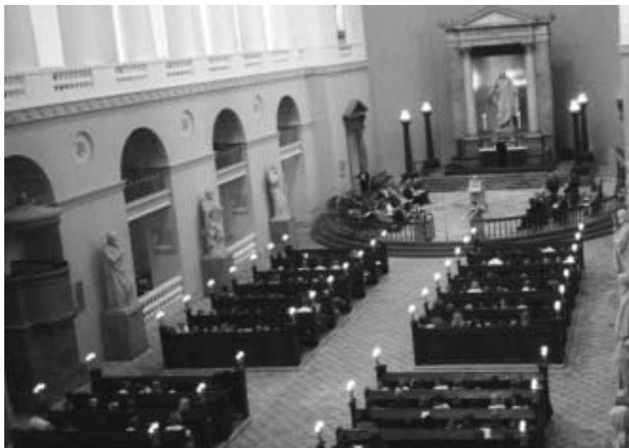
Vor Frue kirke var næsten fyldt

Det var virkelig en festgudstjeneste, som vi altid vil mindes med glæde. red.