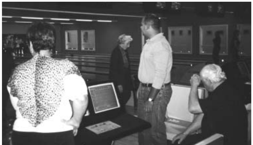
Formanden overvågede at det hele gik rigtigt til under bowlingarrangementet