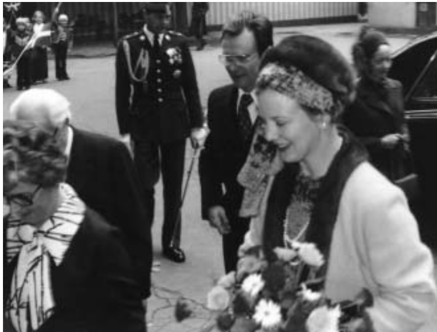
Dronningen ankommer til skolen i 1977