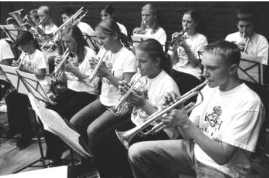
Skolens blæserorkester spillede to flotte numre, helt professionelt, til stiftelsesfesten 2002